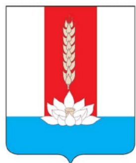
СХЕМА ТЕРРИТОРИАЛЬНОГО ПЛАНИРОВАНИЯ ЧЕРНИГОВСКОГО МУНИЦИПАЛЬНОГО РАЙОНА ПРИМОРСКОГО КРАЯ