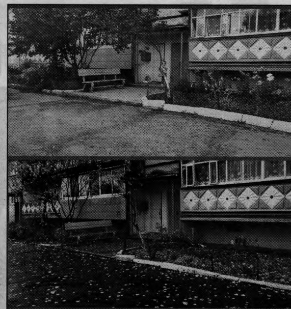
Было и стало - с. Снегуровка, ул. Парковая, 25

«Программа ТОСов позволяет решать вопросы собственными силами и делать это достаточно быстро, в течение года. И, конечно, мы приветствуем решения, которые позволяют расширить возможности территориального общественного самоуправления. Люди поверили, увидев результаты труда у своих соседей, и начали тоже активно включаться в общее дело. Они на собственном опыте убедились, что террито-