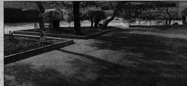
Красиво во дворе — с. Черниговка, ул. Ленинская, 52

В Черниговке тоже есть ТОСы, которые получили гранты на благоустройство придомовых территорий. Новый асфальт радует жильцов домов по улице Ленинской, 52 и Лазо, 36. Жители дома по улице Лазо, 36 в своем проекте позаботились и о благоустройстве дорожки от дома до улицы Лазо.