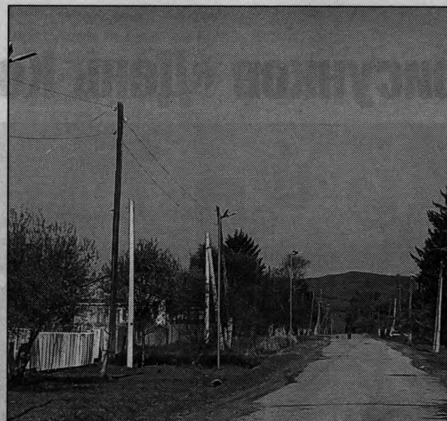
Установили фонари на улице Октябрьской в Снегуровке

- Какие-то вопросы можно решить силами жильцов, к примеру, высадка цветов на клумбы, покраска почтовых ящиков или лавочек, или с помощью управляющей компании. Но более глобальные, дорогостоящие проекты можно