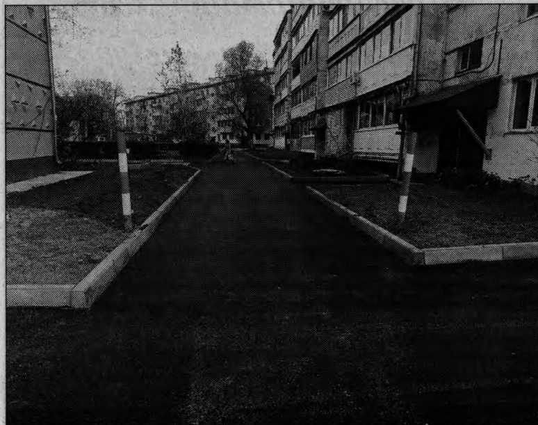
Асфальт во дворе — п. Сибирцево, ул. Строительная, 14