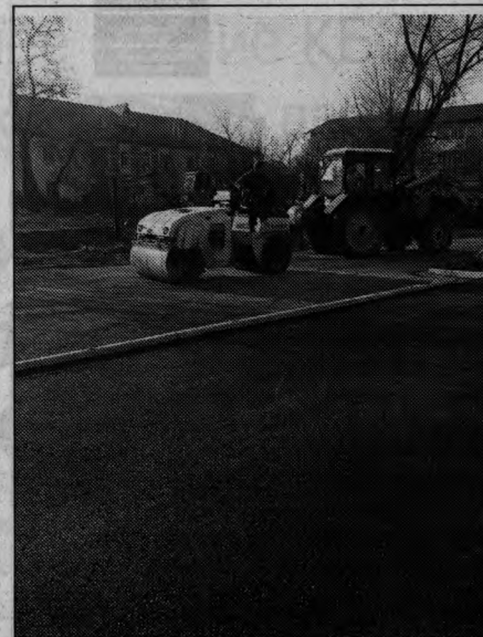
Благоустройство — п. Сибирцево, ул. Деповская, 16