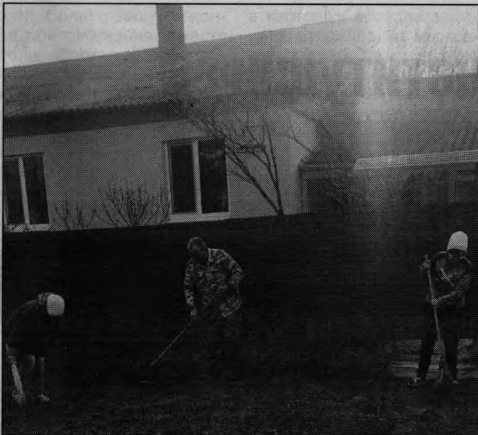
Дружно вышли на субботник

По этой дорожке ходят многие жители села, так как двор дома проходной. Вот так инициатива жителей при поддержке управляющих компаний и власти воплощается в жизнь. Это подтверждают и сами жители домов.