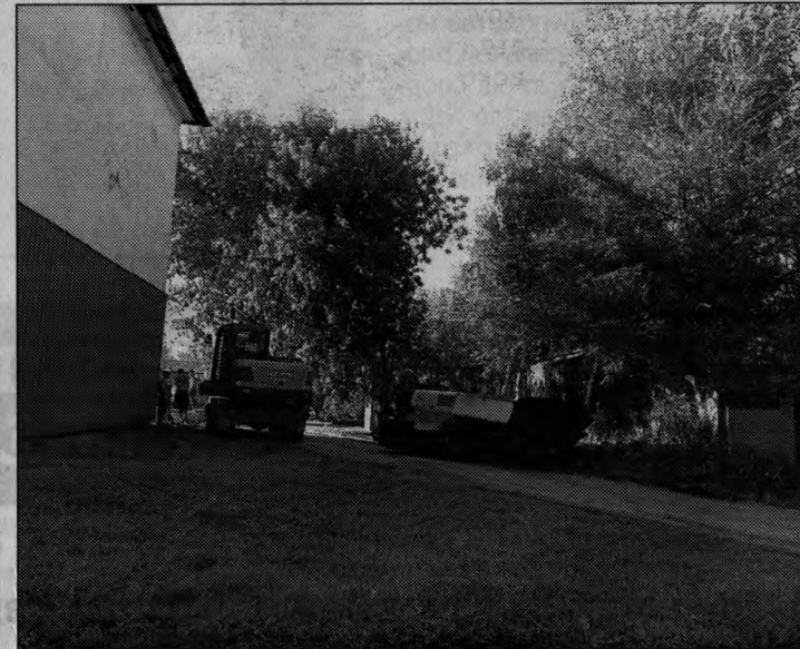
Асфальтирование придомовой территории по ул. Лазо, 36, с. Черниговка